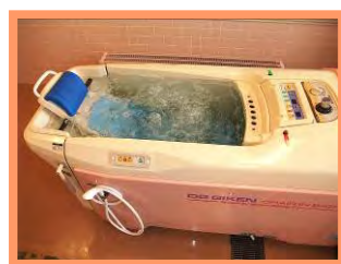
座台式の特殊浴槽