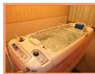
寝台式の特殊浴槽