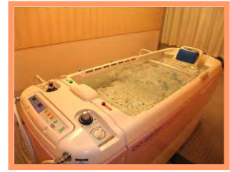
寝台式の特特殊浴槽