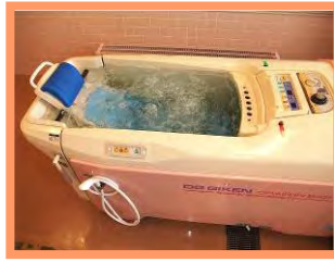
座位式の特特殊浴槽